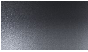
Szary Titane 2900 zł brutto